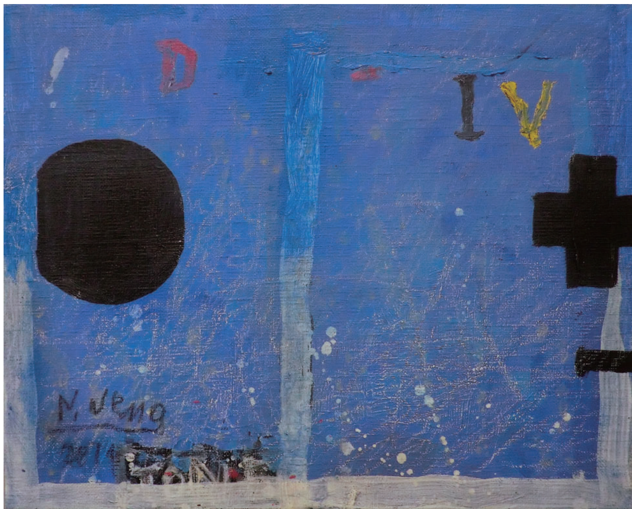
「種子の片影」2015 キャンバスに油彩