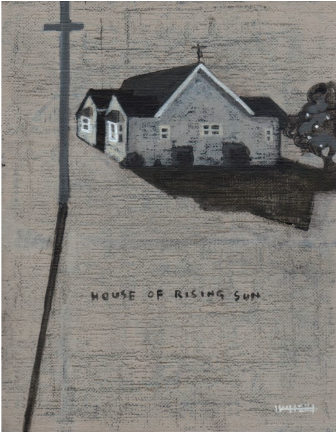
「HOUSE OF RISING SUN」キャンバスにアクリル F0 (180×140mm)

2015年 9月20日(日) — 11月3日(祝・火) 10時—17時 火・水曜 休館 *9月22日・23日・11月3日の祝日火・水曜は開館