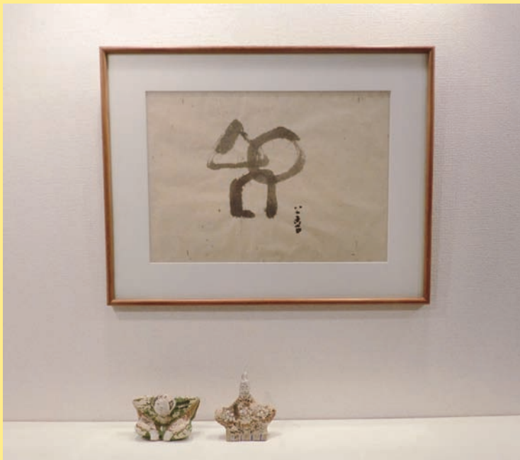
「○△□」坂本善三 と 相良人形(江戸期作) 心の花美術館蔵