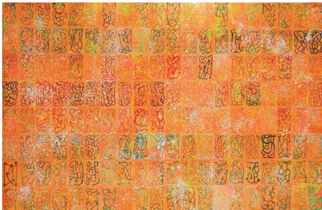
「タイヨウノイロドリ」サイズ・72.8×110cm 素材・アクリルガッシュ・クレヨン・名刺紙