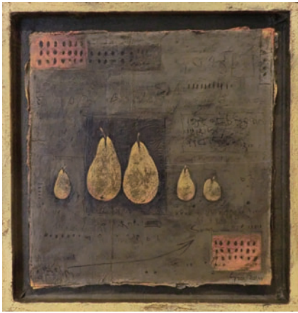
わたなべゆう「NO513」油彩