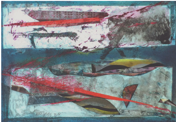
「川」 コラージュ・クレパス