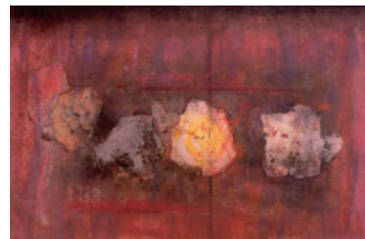
「家族」 コラージュ・クレパス