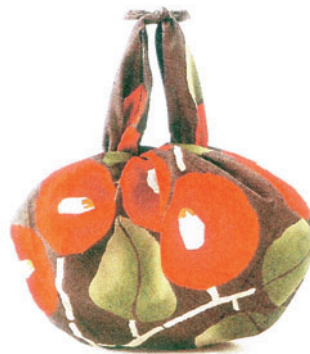
二巾巾風呂敷 (90×90cm) 「竹久夢二」アートグッズ